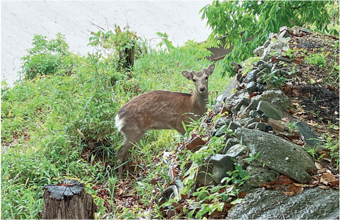
大倭紫陽花邑に遊びに来た奈良公園の鹿

★発行日 令和6年6月23日 ★発行所 大倭出版局 〒631-0042 奈良市大倭町1の12 ☎(0742)45-1192 ★印刷 大倭印刷 監修 ★定価 1部 300円 年間購読料3,500円(送料共) ★郵便振替 01050-6-67002 大倭出版局 URL http://www.ohyamato.jp